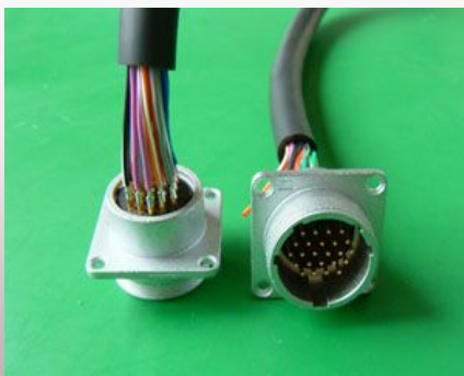
多極のはんだ付け