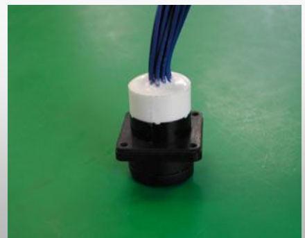
シリコン充填(防水性・絶縁性向上)