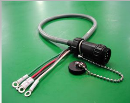
圧着端子・マークチューブへの端子番号の印字