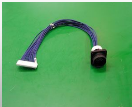
他社角型とのハーネス