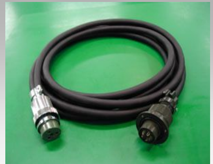
端末に他社製品を使用するアッセンブリ