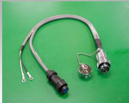
二股の特殊アッセンブリ